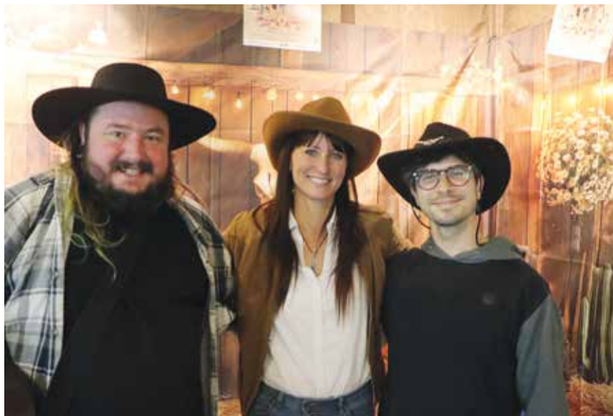
Les acteurs de La Décharge dégaineront dès le soir du Réveillon.

Si vous désirez nous faire part d'un événement qui se déroule au Val-de-Ruz, faites-nous parvenir vos informations détaillées par courriel à l'adresse redaction@valderuzinfo.ch . Le délai d'envoi des textes pour le numéro 336 (à paraître le 15 janvier 2026) est fixé au mardi 6 janvier . Le libellé de l'annonce est du ressort de la rédaction. Les lotos, matches aux cartes, cours particuliers, ne sont pas référencés dans l'agenda. Pour ce genre de manifestation, il faut se référer à la rubrique petites annonces sur www.valderuzinfo.ch