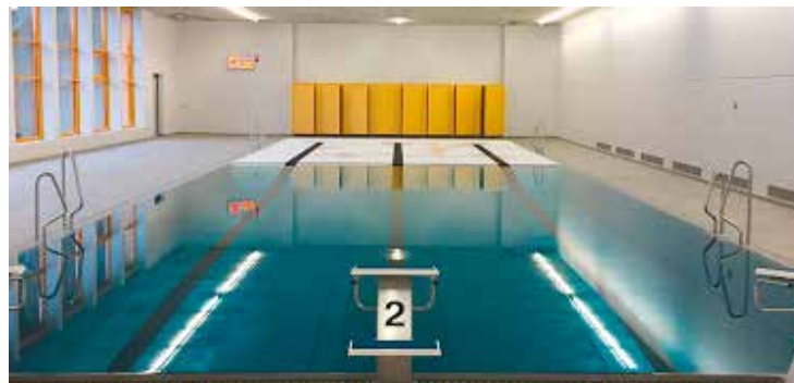
Bassin de La Fontenelle

De plus amples informations sur les tarifs et abonnements sont disponibles sur le site internet communal. Le service sports-loisirs-culture renseigne au 032 886 56 33 ou à l'adresse loisirs.vdr@ne.ch .