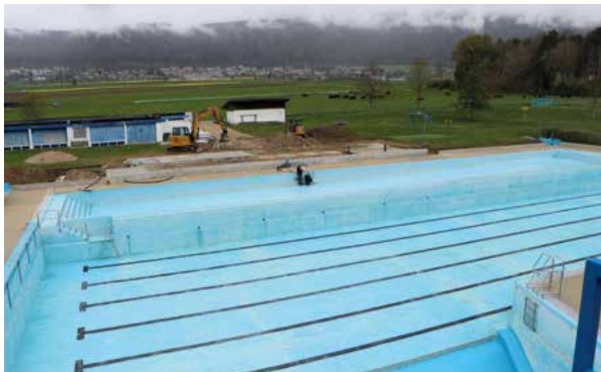
Parmi les investissements à consentir, figure la rénovation des bassins de la piscine d'Engollon (photo pif).

Le budget 2026 de la commune de Val-de-Ruz présente un déficit de 586'600 francs. L'exécutif souhaite réaliser d'importants investissements pour rattraper, notamment, le retard enregistré sur le front des rénovations routières et dans le domaine des eaux. Ces investissements se montent à plus de 23 millions de francs, ils nécessitent une dérogation au frein à l'endettement. Décryptage.