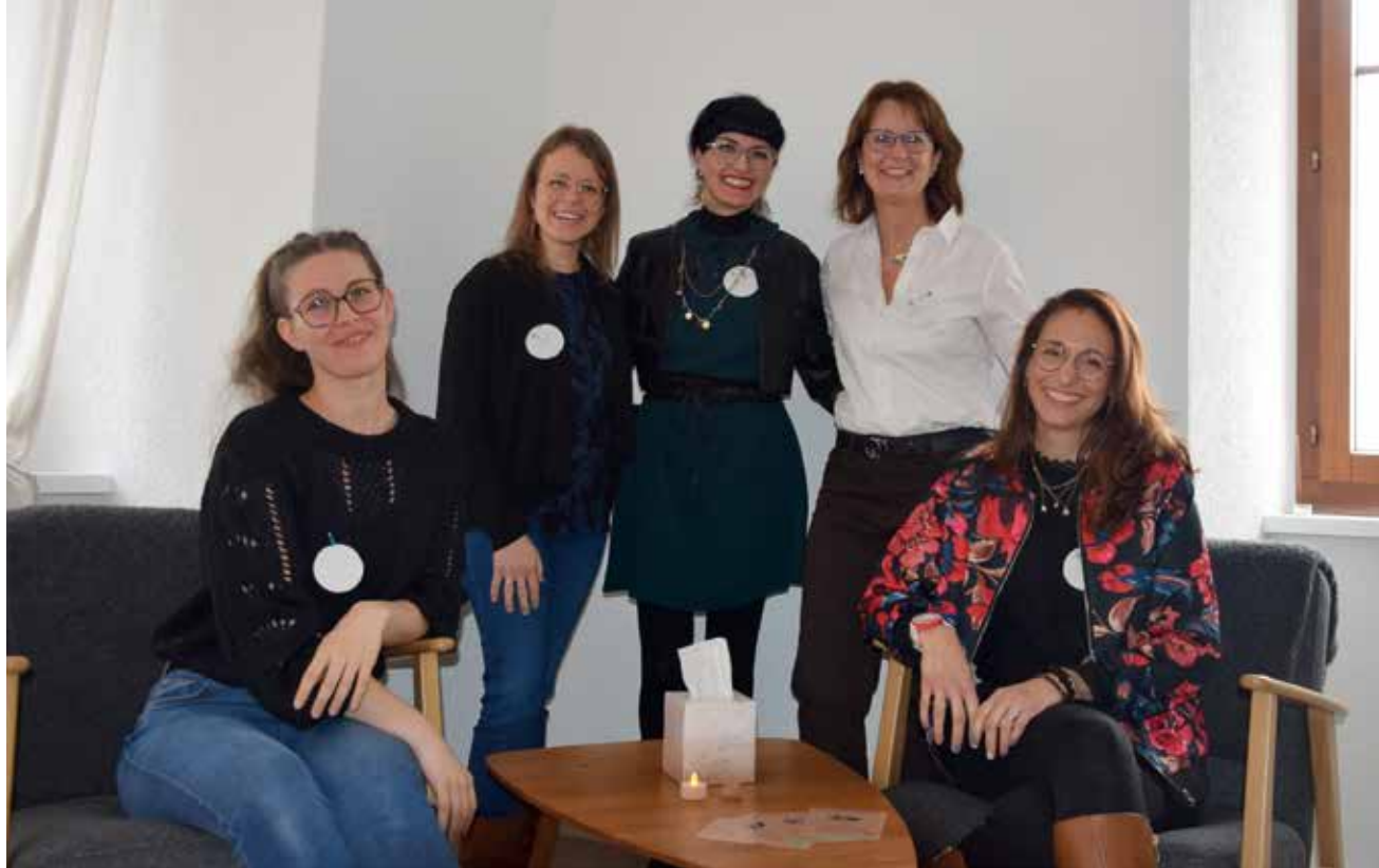
Le comité de l'association du «Centre thérapies & bien-être du Val-de-Ruz» au complet (photo pif).

Le «Centre thérapies & bien-être du Val-de-Ruz» a célébré sa première année d'existence par une journée portes ouvertes le 13 décembre aux Geneveys-sur-Coffrane. En une année, la structure a élargi son offre et elle s'est enrichie de nouveaux thérapeutes.