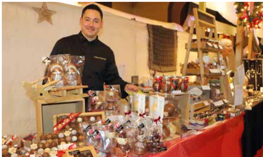
Noël, ce sont aussi de petites douceurs. Ici au marché de Cernier.