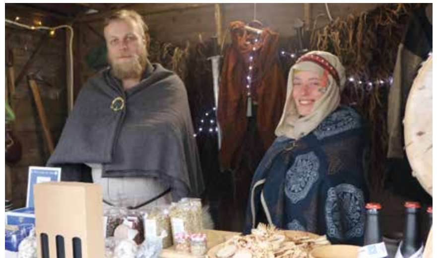
A Savagnier, dans leur tenue médiévale, ils pourraient ressembler à Joseph et Marie.