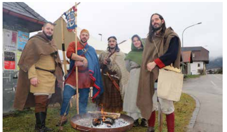
Les Loups de Fenrir ont donné une touche médiévale au marché de Savagnier (photo pif).

Il y a eu le marché de Noël de la Lessiverie de Chézard-Saint-Martin, du Magasin du Monde à Cernier, celui des créatrices et cie qui s'est tenu pour la cinquième année consécutive au Moulin de Bayerel, le P'tit marché de Noël de Dombresson, celui du Centre pédagogique de Malvilliers ou encore du Mycorama. A Savagnier, la population avait le choix entre deux événements, l'un à la Rincieure, au chaud à l'intérieur, l'autre à l'extérieur dans un registre totalement différent au Petit Savagnier. Autour des petits chalets en bois très cosy, les Loups de Fenrir se sont chargés de donner une ambiance médiévale à ce marché pas comme les autres. Cette association rassemble des passionnés de l'époque des Vikings et du Moyen-Age. Mais même si l'hydromel était chaud et goûtu, la pluie est venue gâcher la fête. Mais les nobles et les gueux de l'époque en ont vu d'autres. /pif