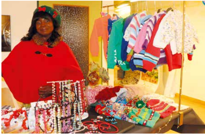
A Landeyeux, un stand est destiné à présenter les réalisations des résidents (photo pif).

Au Val-de-Ruz, les marchés de Noël bourgeonnent au début de l'hiver comme le noisetier à l'aube du printemps. Ils sont trop nombreux pour pouvoir en livrer une liste exhaustive, sans en oublier un. Petit tour en images au Moulin de Bayerel, à Savagnier ou encore à Cernier et à Landeyeux.